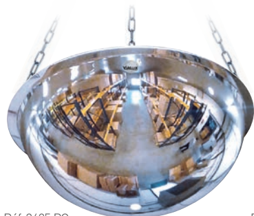
Réf. 3695 PC